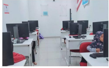
Pengguna sedang menggunakan komputer di Padi Kg Berkat.