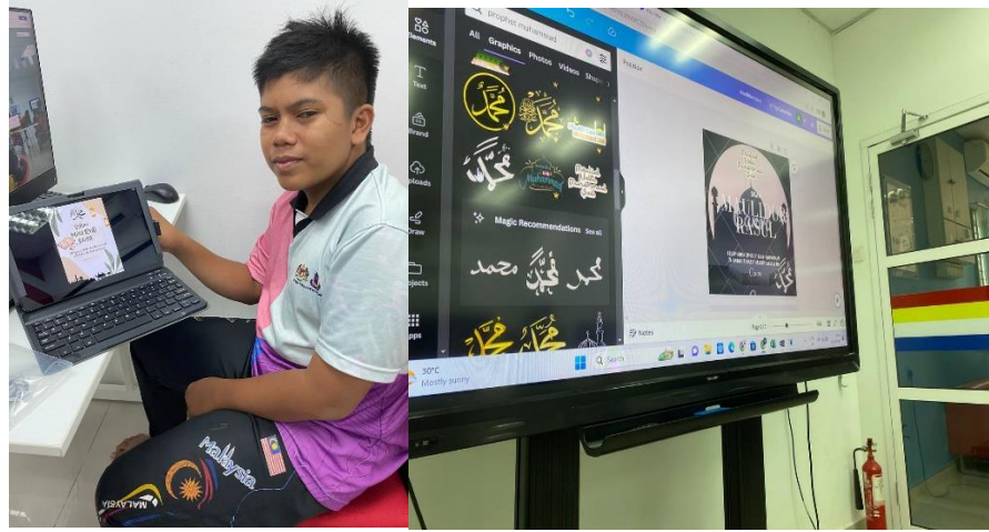
Pengguna hadir menggunakan komputer di Pedi Kg Berkat