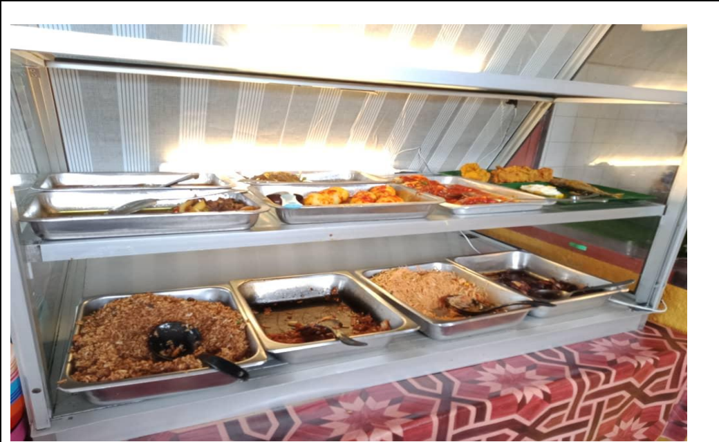
Caption : Antara menu masakan utama diletakkan di ruang yang besar dan mudah diambil oleh pelanggan